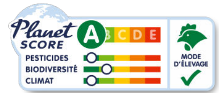
Exemple affichage Planet-Score

Suite à un appel à propositions lancé par le Ministère de la transition écologique, des systèmes « d'affichage environnemental » ont été proposés. Le Planet-score est l'étiquetage environnemental qui est plébiscité par les consommateurs (63% contre 25% pour le système Impact Environnemental et 12% pour l'Eco-score). C'est également celui que soutient UFC-Que Choisir.