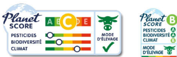
Le Planet-score en grand format et format « timbre »

de l'Institut technique de l'agriculture biologique, ce dispositif intègre les dimensions de climat, de biodiversité et de pesticides, ainsi que le mode d'élevage pour les productions animales.